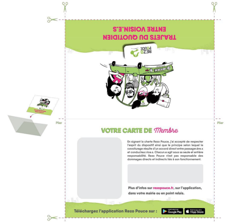
Carte de membre