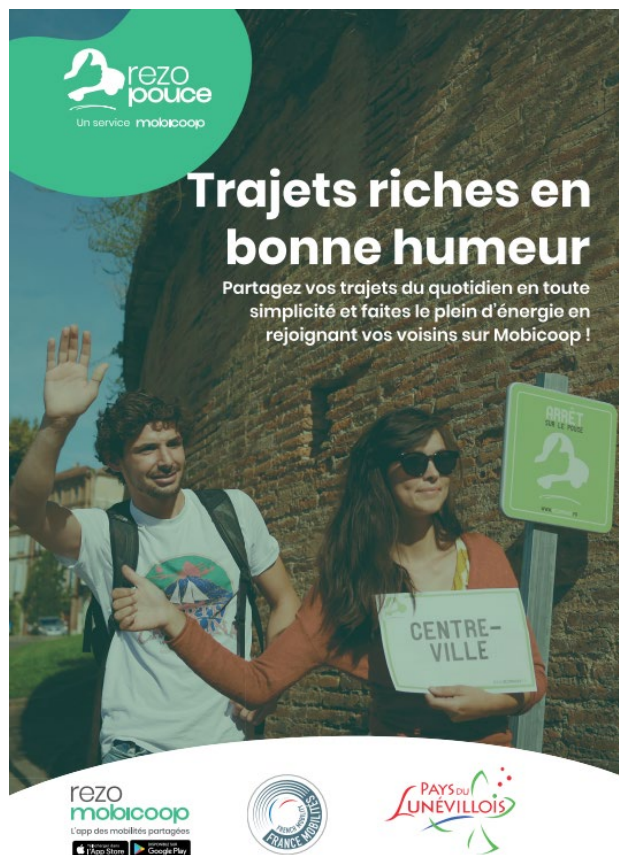
Affiche au format A3